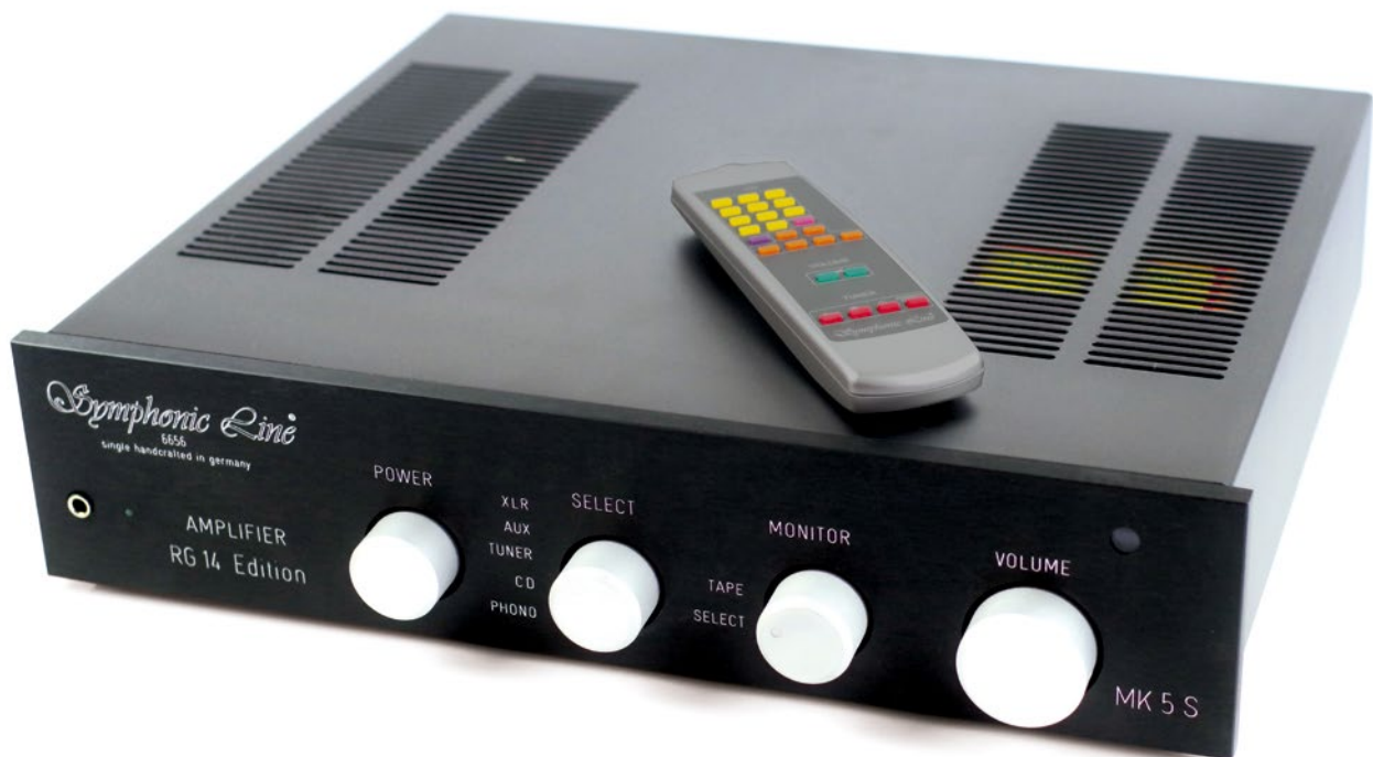
Vollverstärker Symphonic Line RG14 Edition Mk5 S